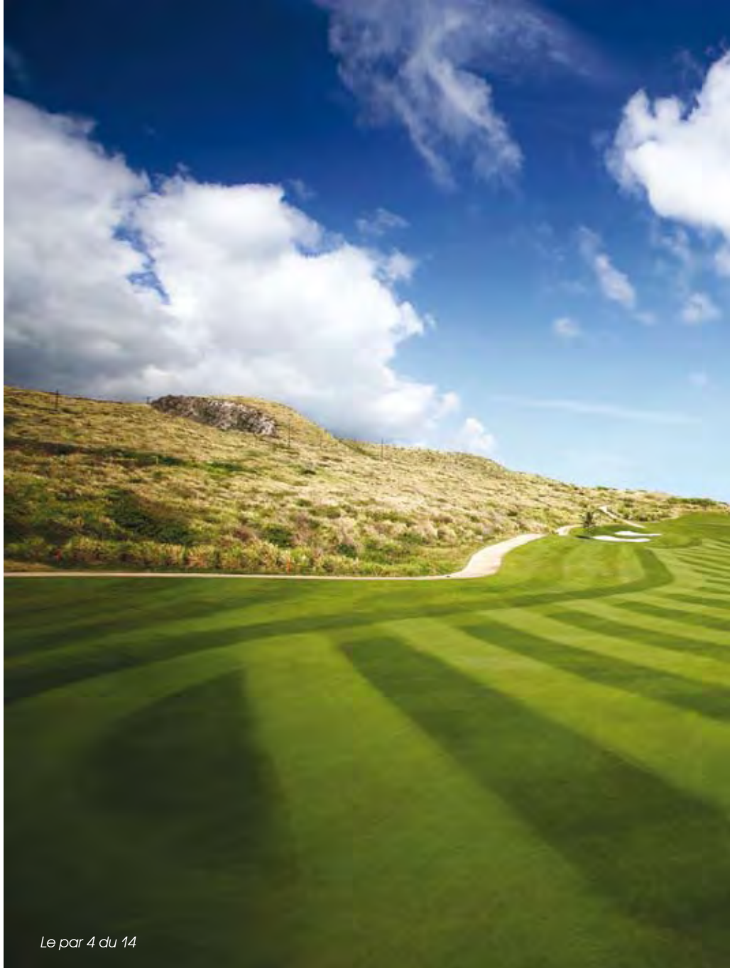
Le par 4 du 14

pouvant plus attendre de vous faire partager la magie des huit derniers trous qui vous amèneront, crescendo, sur un finish d'anthologie !